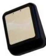
Væglæser ved porte

Som beboer på Fredensgade Kollegiet, får du ikke en nøgle til din dør. Dørene på hele kollegiet er forsynet med elektroniske låse. I stedet for en nøgle får du udleveret en NØGLEBRIK.