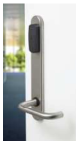
Langskilt med læser på døre